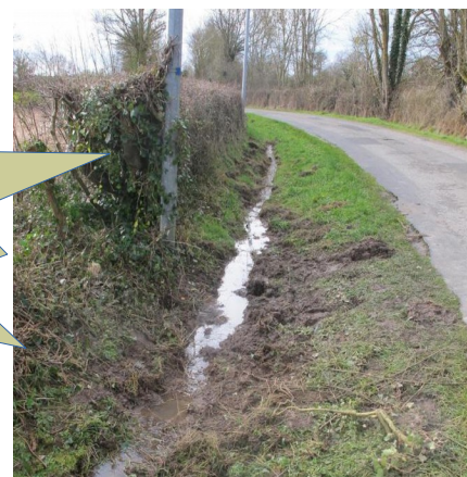
Fossé en eau

Cours d'eau / fossé ? Attention aux risques de confusion