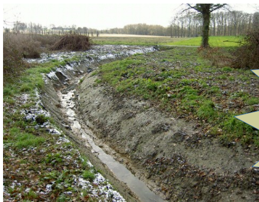
Cours d'eau recalibré

Sur le terrain, la distinction entre cours d'eau et fossé s'avère délicate. Cette distinction est pourtant importante car une intervention sur un fossé pourra se faire sans démarche administrative tandis qu'une intervention sur un cours d'eau allant au-delà de l'entretien courant (cf fiche « entretien des cours d'eau ») nécessitera le dépôt d'un dossier de déclaration ou d'autorisation « loi sur l'eau » et pourra même être interdite en cas d'impact environnemental important.