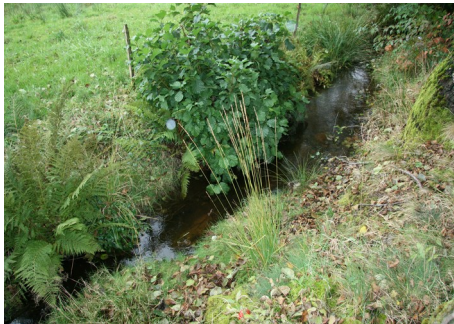
Ruisseau à Le Thillot, absent sur carte IGN