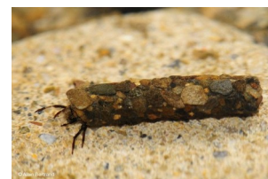
Trichoptères à fourreaux

- Présence de traces évidentes de vie : crustacés et mollusques (coquilles vides ou non, vers (planaires, achètes), coléoptères, trichoptères (fourreaux vides ou non) ;