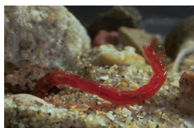
larve de chironomes

- Présence de macro-invertébrés benthiques (vivants dans le fond du lit) ayant un cycle de vie complet en milieu aquatique (larve de chironomes, oligochètes, copépodes) ;