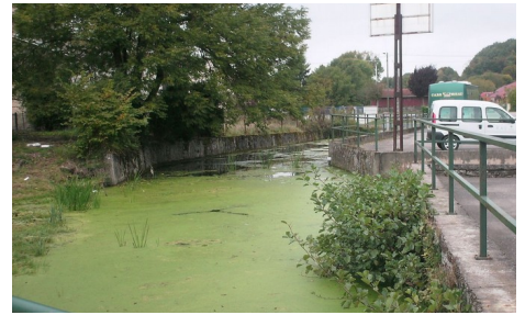
La Vraine à Domjulien